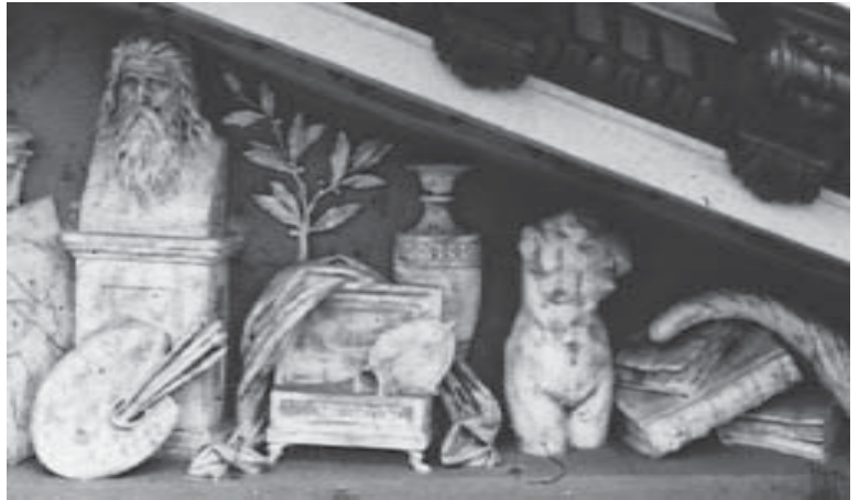
Ateneum-rakennuksen friisi, yksityiskohta

Museomme henkilökunnan tekemät kysymykset liittyivät luonnollisesti enimmäkseen tekeillä oleviin näyttely-, tutkimus-, dokumentointi- ja julkaisuprojekteihin, joista kirjastoa eniten työllistivät näyttelyt ”Miriskusstva”, ”Juho Rissanen ja suomalainen kansa” ja nyt tekeillä olevat Hugo Simbergin ja Albrecht Dürerin näyttelyt, Kuvataiteen keskusarkiston ”Taiteilijan puheenvuoro”-haastatteluprojekti ja uusi julkaisu ”Kirjoituksia taiteesta 2” sekä dia- ja kuva-arkiston