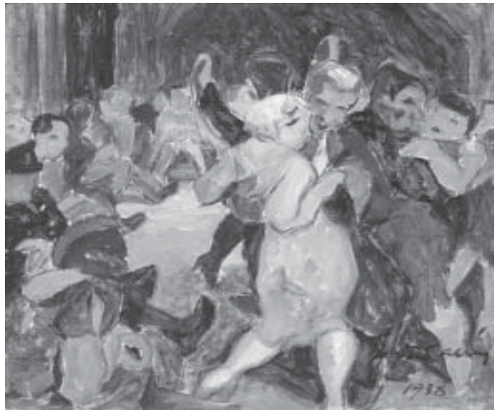
Saari Yrjö: Tanssit, 1938

Nykyisin leikearkistoon tulee vuosittain uusia ajankohtaisia taideartikkeleita noin 4500 kpl maamme 21 suurimmasta päivälehdestä sekä aikakauslehdistä. Arkisto palvelee taiteentutkimusta maanlaajuisesti sekä puhelinpalvelun että myös opastetun tutkijapalvelun