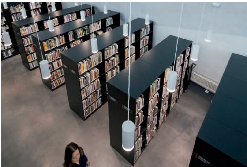
Uudistettuun Kiasma-kirjastoon on vapaa pääsy