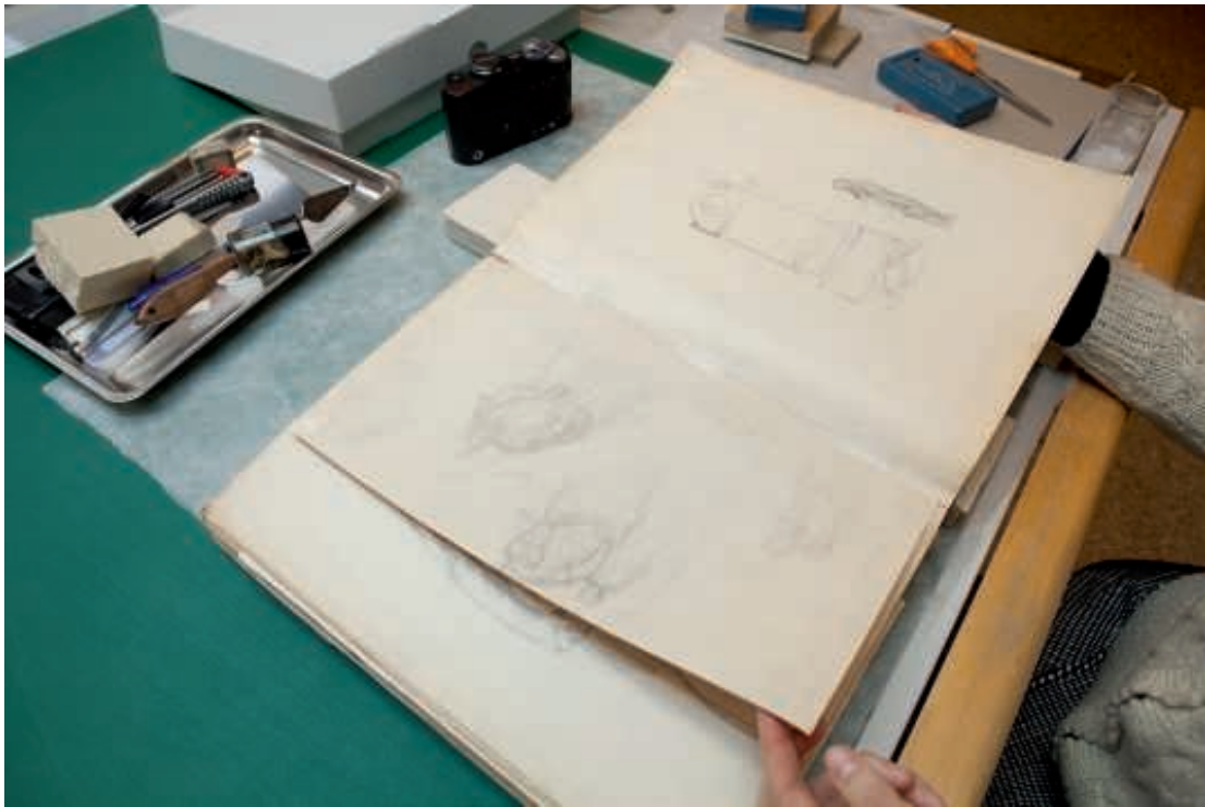
Paperikonservattori työstää Albert Edelfeltin luonnoskirjaa