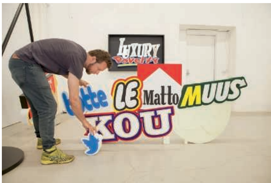
Jani Leinonen: Tottelemattomuuskoulu (2015)

Kiasmassa vieraili vuoden 2015 aikana (9,5 kk) 235 560 kävijää (tavoite 160 000), joista 119 991 (51 %) olivat maksavia asiakkaita.