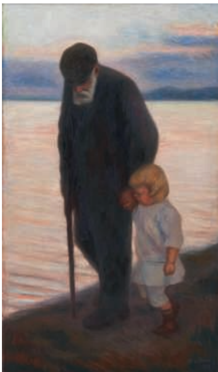
Hugo Simberg, Iltaa kohti (1913)

Ateneumin taidemuseossa vieraili vuoden aikana 263 960 kävijää (tavoite 260 000), joista maksavien asiakkaiden määrä oli 168 238 (63 %).