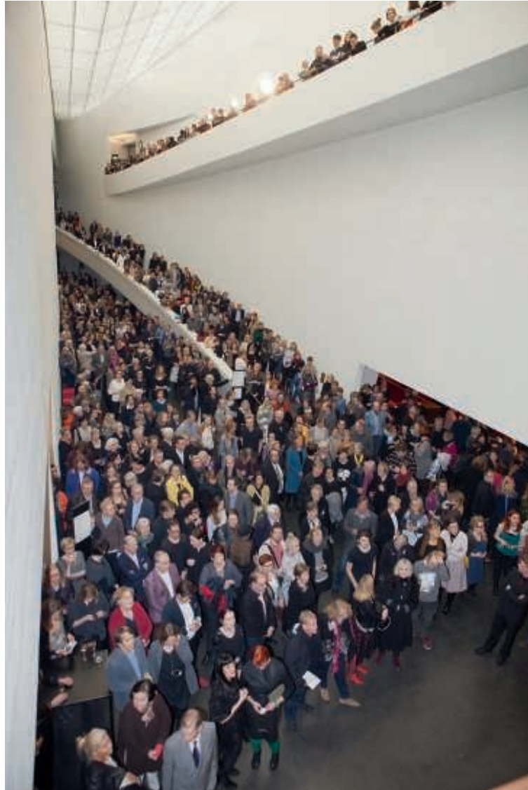
Robert Mapplethorpe -näyttelyn avajaiset Kiasmassa 12.3.2015