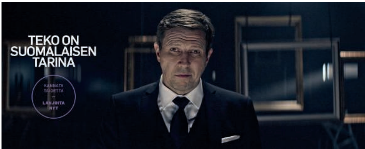
Näyttelijä Martti Suosalo kertoo lyhytelokuvassa Teko on suomalaisen tarina , miksi taide on tärkeää