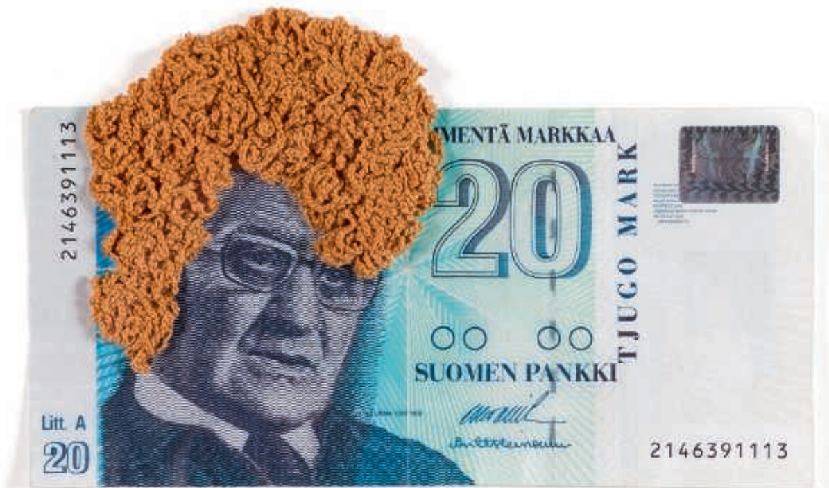
Noora Schroderus: Väinö Linna (2014–2015) Nykytaiteen museo Kiasma