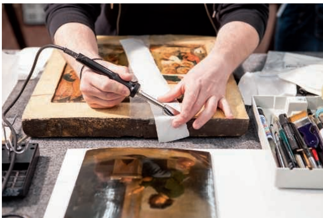
Konservaattori työstää puulle maalattua taideteosta Sinebrychoffin taidemuseossa 2015