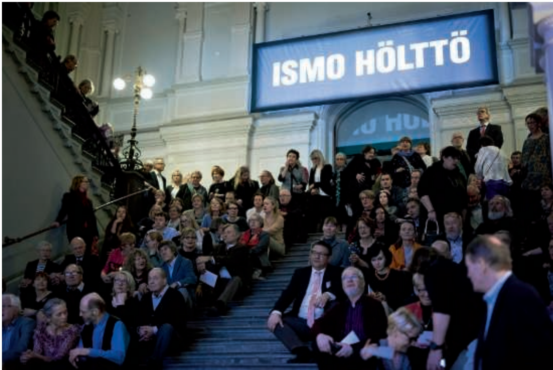
Ismo Höltön retrospektiivinäyttelyn avajaisvieraita Ateneumissa 9.4.2015