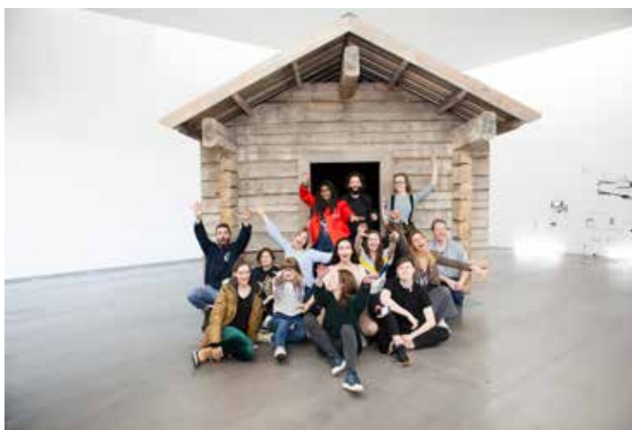
LaBeouf, Rönkkö & Turner: #ALONETOGETHER , 2017

Luettelo kaikista teoshankinnoista liitteessä 3.