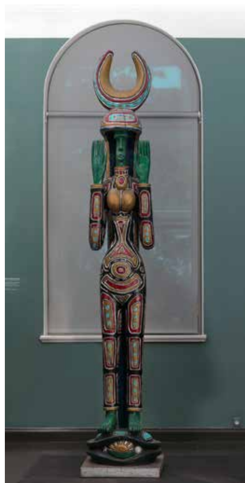
Heikki W. Virolainen, Ilman impi (1970)

Lista kaikista teoshankinnoista liitteessä 3.