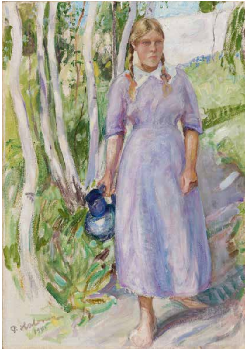
Pekka Halonen, Veden noutaja (1911)