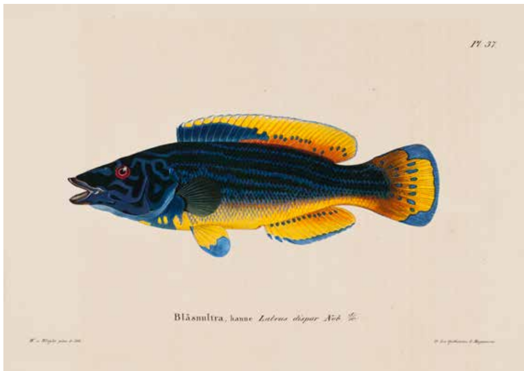
Wilhelm von Wright: Sinihuulikala, koiras (1836–1857).