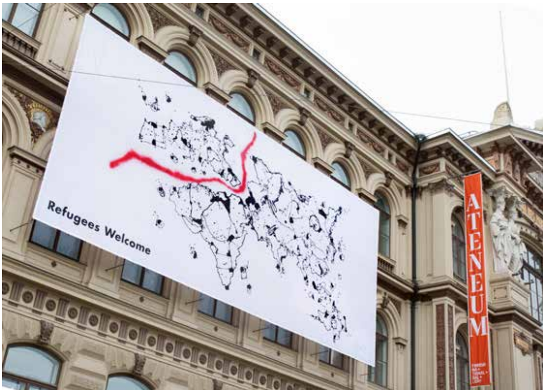
EGS, Europe's Greatest Shame #11 (2017)