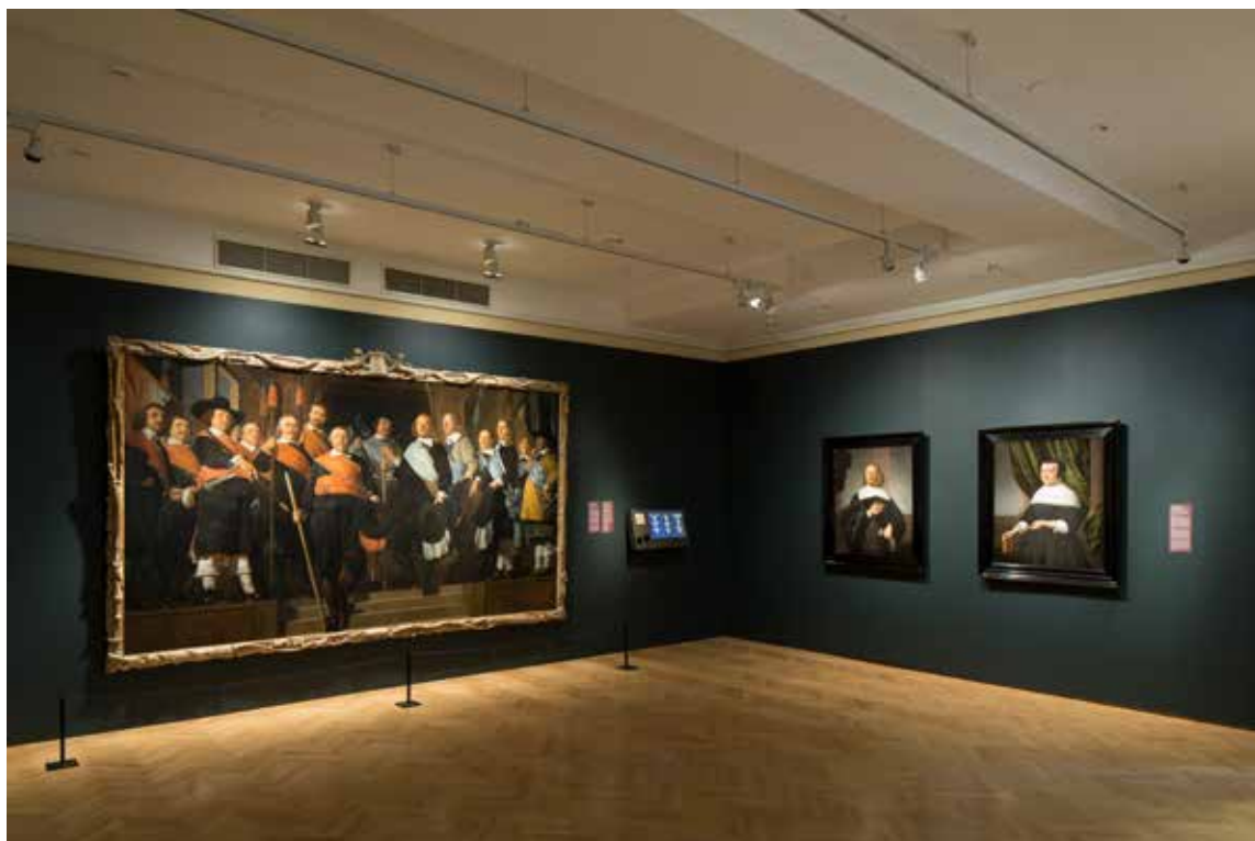
Caesar van Everdingen – Siveltimen mestari Rembrandtin aikaan -näyttely Sinebrychoffin taidemuseossa 16.2.–14.5.2017.

tekemät kokoelmahankinnat luovat uusia kerrostumia Kansallisgallerian kokoelmaan, jonka kautta Suomen historiaa ja taidehistoriaa rakennetaan ja tutkitaan nyt ja tulevaisuudessa.