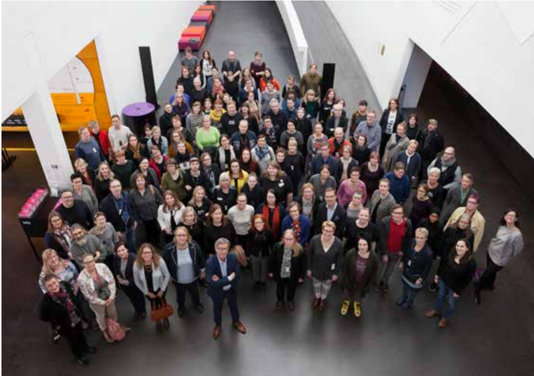
Kansalliskallerian henkilöstö Kiasman aulassa maaliskuussa 2017.